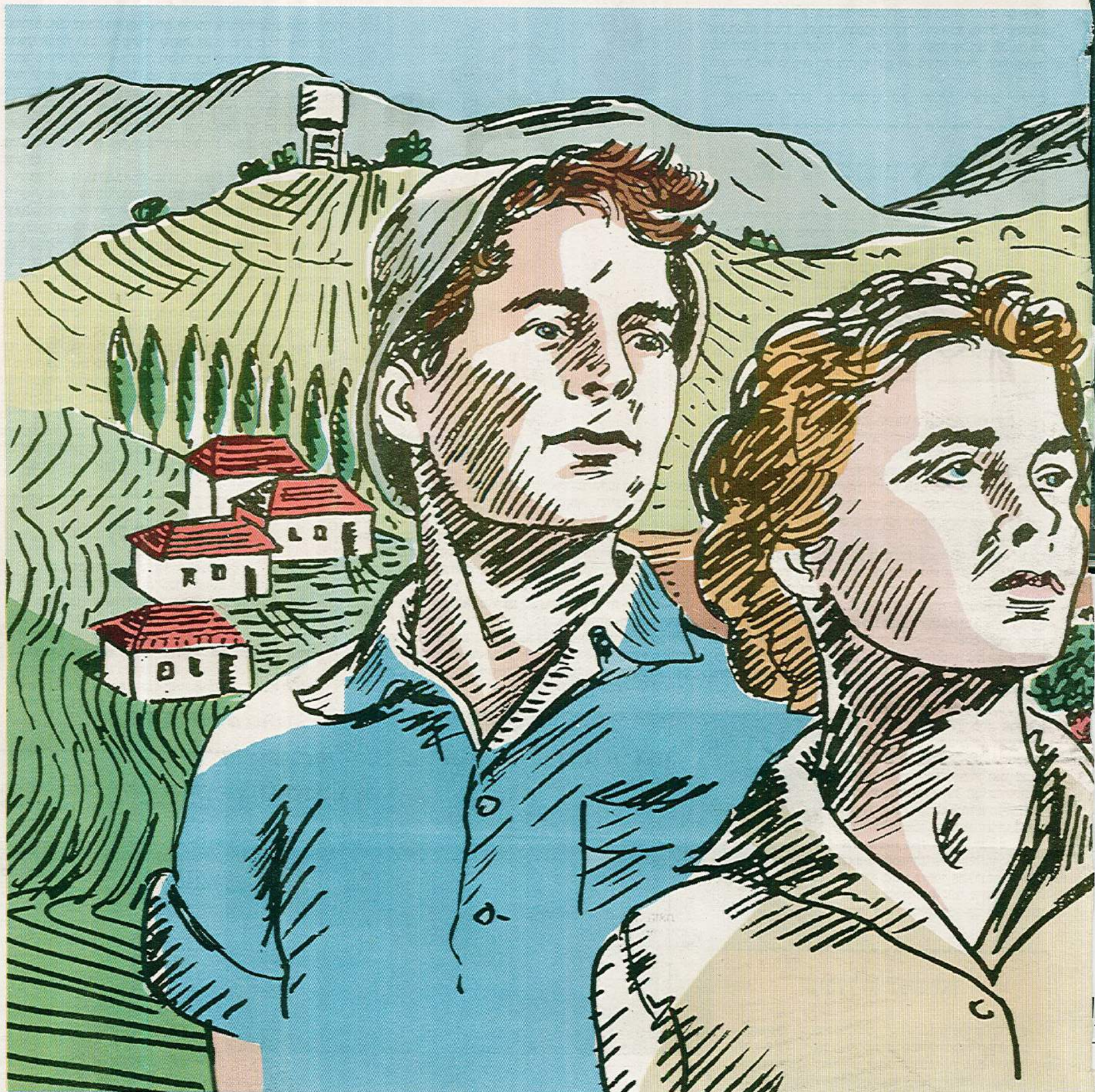
איור: ערן ולקובסקי