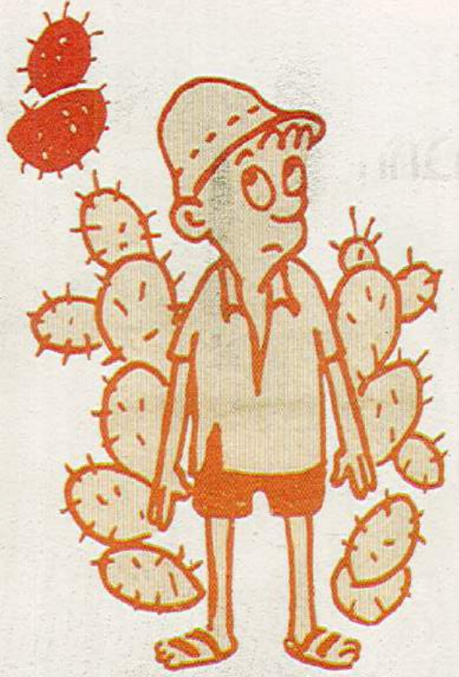
"ישראל הקטן" של דוש, 1951

מצבו של עם הבונה מולדת בימים האחרונים קרה אצלנו מקרה אחד חמור של השתמטות מצד בחור צעיר אחד שהתחנך לא מומן. נוכרתי שפעם שאלת אותי: מה יהיה, יוחנן, כשאנו נחיה יחד, אתה תצא בלילות ואני אשאר לבד בחדר? את התשובה נתתי לך מיד: אנו נחיה יחד אבל יהיו ימים ולילות שאני אהיה אי-שם במשמר ואת תצפי לבואי, מפני שזהו מצבנו, מצבו של עם הבונה מולדת. גם את הבינות יפה שאני לא ארשה לעצמי לשבת בבית בשעה שאחרים יחפרו את נפשם. אני יחידי החושב כך. המקרה שלפנינו הוא מקרה בודד ומרגיז. (חבר קיבוץ תל יוסף בותב לחברתו בימי מלחמת העצמאות)