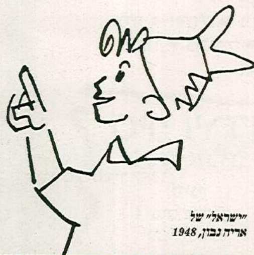
"ישראל" של אריה נבון, 1948

מחובר לסגפנות וניירות. הם היו נזירים בחאקי". עכשיו עובר אלמוג על ספר חדש, שעניינו התפוררות דמות הצבר. בניסוחו, הוא הוקר את "פרק ב' של הצבריות" - הפוסט ציונות. שחיטת הפרות הקדושות, הוא אומר, החלה במלחמת ההתשה ב-69, נמשכה במכתב השמיניסטים ובמחוזותיו של הנדן לויז, התעצמה לאחר מלחמת יום הכיפורים והמהפך הפוליטי ב-77, ושוב בימי מלחמת לבנון ב-82. "הצבר כמודל של מערכת ערכית מפנה את במת ההיסטוריה. היא נמוגה, אין לה כבר תפקיד למלא. בעיני, המפגש בין יצחק רבין לאביב גפן היה כמעט מטאפורה תקופתית: הצבר המיתולוגי מכיר בממשיכו, בדמות החדשה, ומחבק אותה. כאילו אומר: 'אוקיי, לא שירתת בצבא, אתה זמר, אתה מתאפר, אתה דמות קצת אנדרווגינית, אבל אני מקבל את זה'".