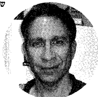
פרופ' עוז אלמוג